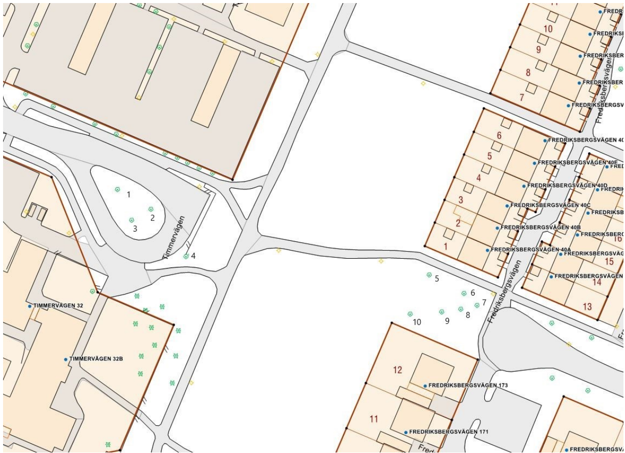
Träd nr 1-3 – Avenbok, högt Bevarandevärde. kompenseras vid fällning